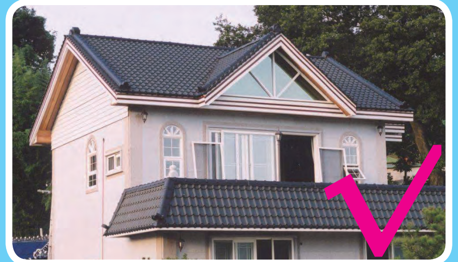
色彩符合楚雄州特色风貌要求的彩钢瓦实例二