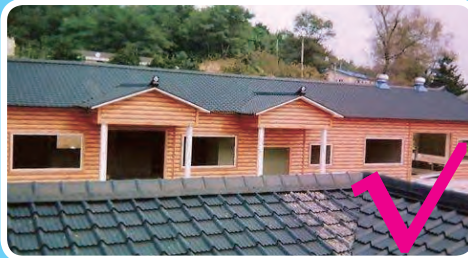
色彩符合楚雄州特色风貌要求的彩钢瓦实例一