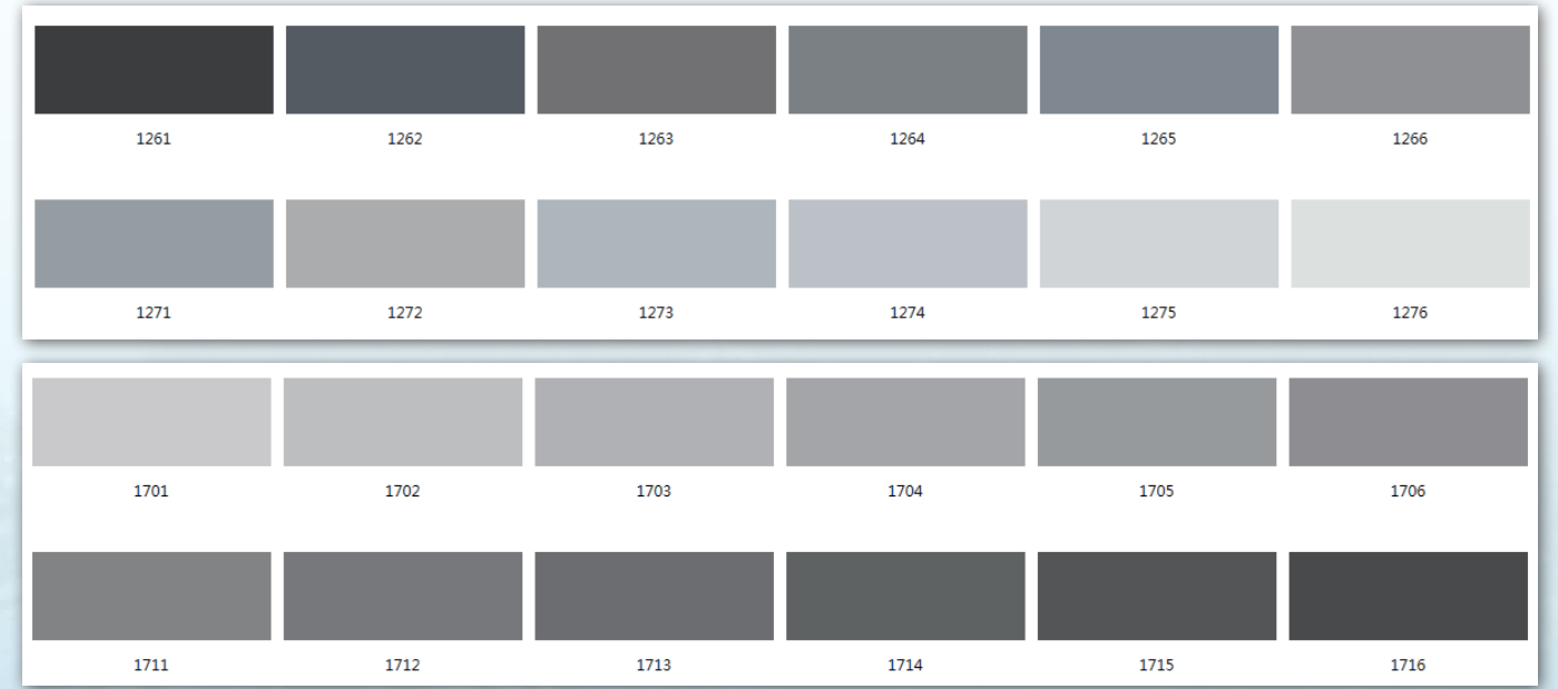
符合楚雄州特色风貌要求的彩钢瓦色卡

楚雄州住房和城乡建设局 楚雄州工业和信息化委员会 楚雄州质量技术监督局 2018年2月22日