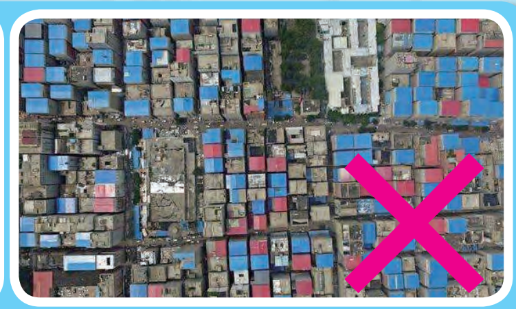
彩钢瓦色彩影响特色风貌的样例