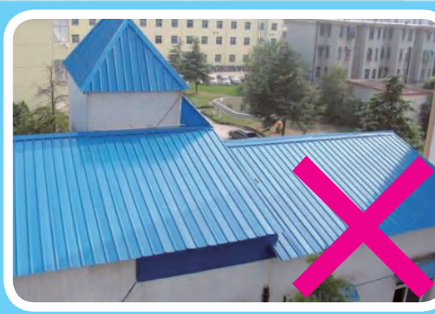
色彩不符合楚雄州特色风貌要求的彩钢瓦实例