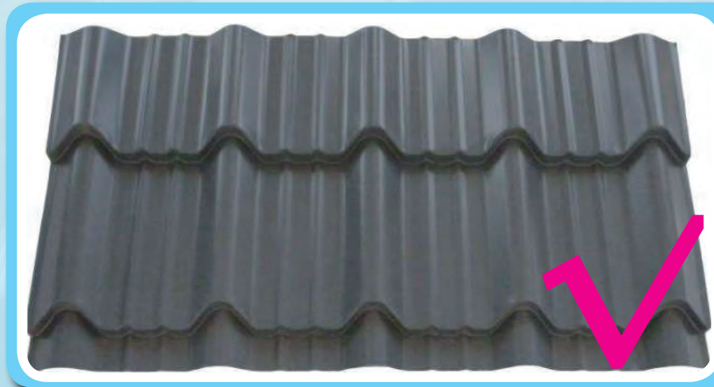
色彩符合楚雄州特色风貌要求的彩钢瓦样例