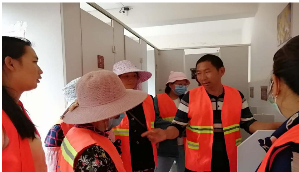
（图为“扫厕所”专项行动现场）

学生人数不超过 50 人标准），公园、广场 10 个，医疗机构 207 个，客运站 18 个，旅游景区 7 个，建筑企业、施工工地、物业、房地产 65 个。现已开工建设 547 个，建成投入使用 370 个。