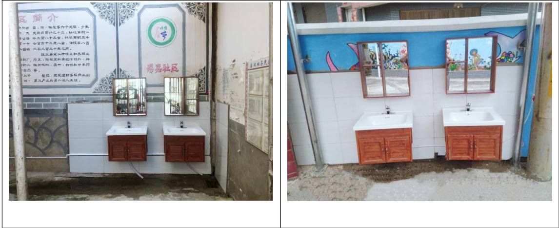
(图为碣嘉社区和碣嘉幼儿园洗手池)