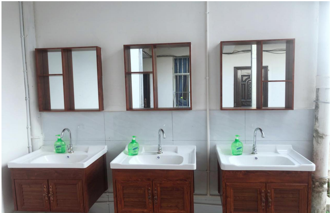
(图为碣嘉镇政府大院公共区域洗手池)