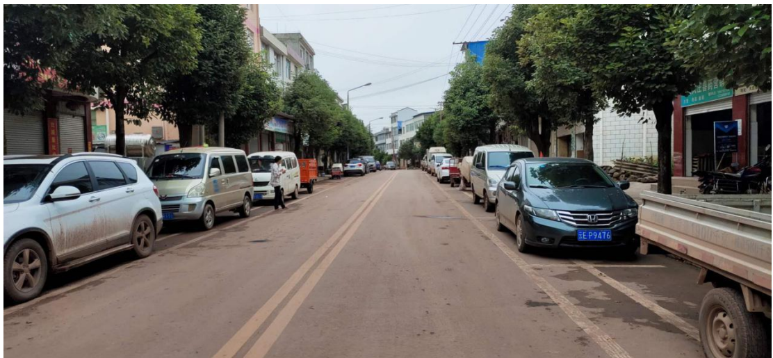
(双柏县住房和城乡建设局)

此次专项整治活动共有干部职工 70 余人次参与，通过整治，大庄镇农贸市场由“脏乱差”逐步向卫生、标准转化，进一步提高了集镇卫生质量，为不断提升居民健康素养提供有力保障，得到集镇居民一致好评，在接下来的工作中，大庄镇党委政府将把整治集镇农贸市场作为创建“卫生乡镇”的一项常规性工作来抓，以点带面，确保爱国卫生专项行动落地见效。