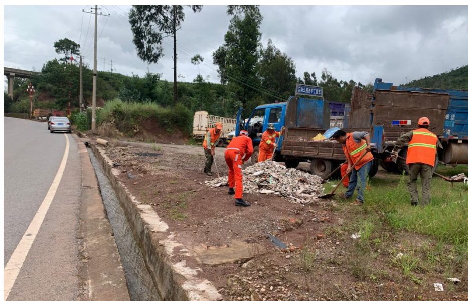
（图为“清垃圾”专项行动现场）