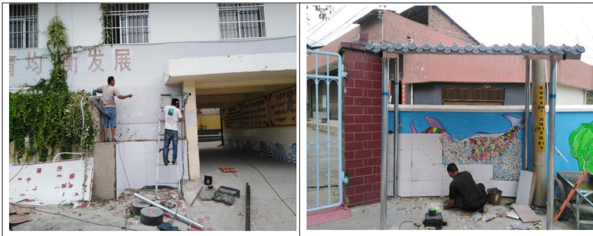
（图为礅嘉小学和礅嘉幼儿园洗手台建设施工现场）

目前全镇已建设洗手设施共计 45 套，其中高标准公共洗手设施 36 套，分别是在政府大院（6）、卫生院（1）、礅嘉中学（2）、礅嘉小学（2）、礅嘉社区（2）、农贸市场（2）、邮政所（2）、财政所（1）、农业农村服务中心（1）、烟草公司（1）、信用社（1）；除茶叶外的 8 个村完小和阳太幼儿园便捷实用式公共洗手设施 9 套。接下来，我们会继续配合有关部门做好爱国卫生行动宣传工作，引导人民群众养成“勤洗手、讲卫生”的生活习惯，与提升城镇人居环境、建设卫生乡镇、引领健康风尚等工作同安排、同部署、同推进，在全镇上下吹响爱国卫生运动的号角，营造全民关注、全民参与、全民支持的浓厚氛围！